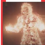
Una scena del film