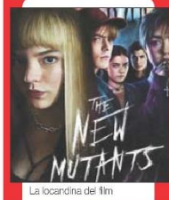
La locandina del film