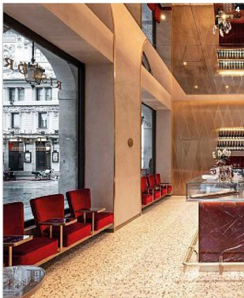
4 | Il Foyer: raccoglie l'eredità del Marchesino. 5 | Il quartetto americano Third Coast Percussion, ospite a MiTo Settembre Musica (teatro Elfo Puccini, 16/9). 6 | Valhalla: cucina vichinga in zona Navigli. 7 | Lenoteca naturale, all'interno della sede di Emergency. 8 | Il Festival del disegno, al Castello Sforzesco.